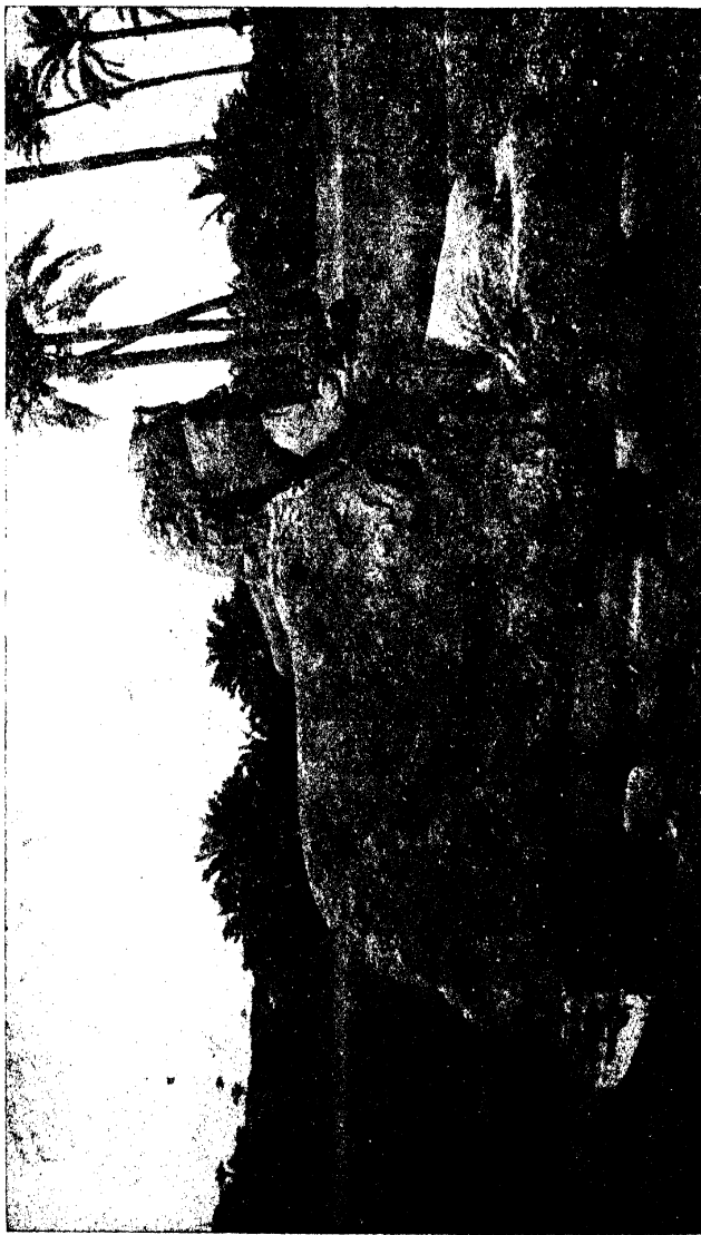
मोम्बिस में एक स्फिक्स